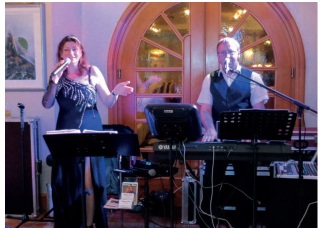
Unsere Musik - Das Sunny-Duo