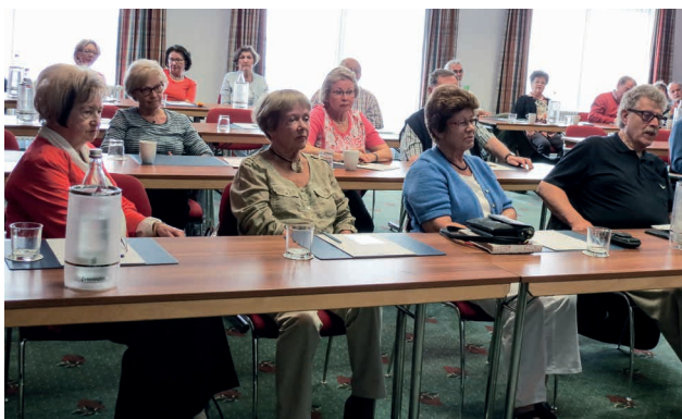
Blick ins Plenum

Der Vorsitzende bedankt sich, auch im Namen seiner Vorstandskollegen, bei den Mitgliedern für das Vertrauen und berichtet dann, dass im Vorstand diverse Ideen diskutiert worden seien, wie man die Mitglieder, die zum „Spöhrax-Fest“ kommen, finanziell entlasten könne. So habe man z.B. darüber nachgedacht, dass man jedem Mitglied am Fest eine Flasche Wein aus der Vereinskasse bezahlt, doch stelle sich die Frage, ob Rot- oder Weißwein, wenn diese Entscheidung gefallen sei, ob man dann verschiedene Rebsorten auswählen solle etc. Diese Idee sei dann wieder verworfen worden.